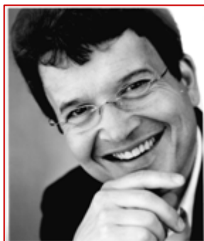
Leitende Lehrkraft und Geschäftsführer der Lymphologic GmbH