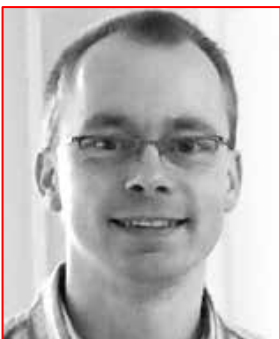
Bachelor of Physiotherapy Manualtherapeut, Fachlehrer MT